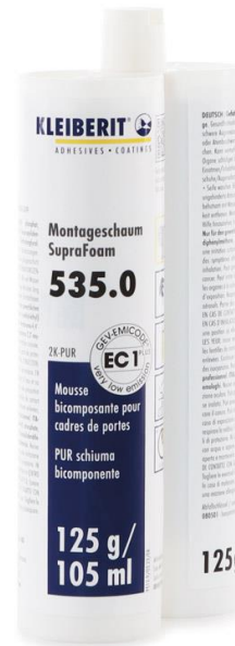
KLEIBERIT 535.0 SupraFoam en cartouche à double cylindre